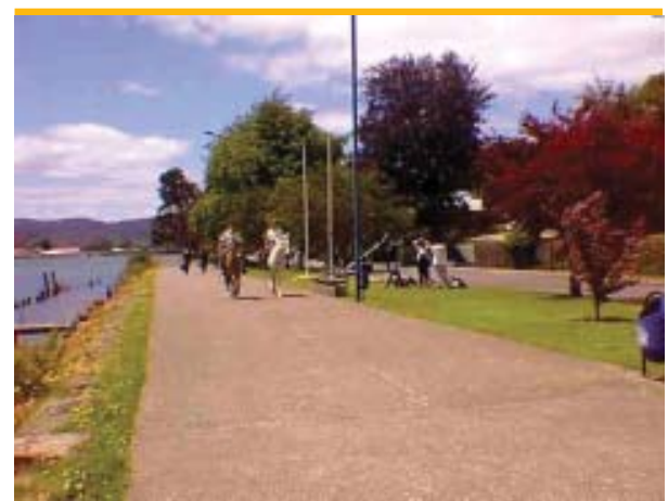
Paseo costanera Arturo Prat, borde Río Valdivia, entre los puentes Valdivia y Calle - Calle. Se estima que 25.000 turistas recorren este lugar de encuentro y de belleza