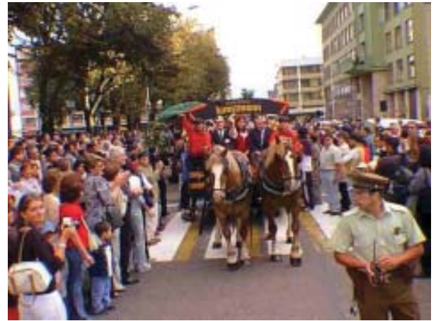
Fiesta de la Cerveza:

Finalmente es posible afrontar el crecimiento urbano con desarrollo endógeno y exógeno equilibrado dentro de una planificación por metas que esta dispuesta a cumplir.