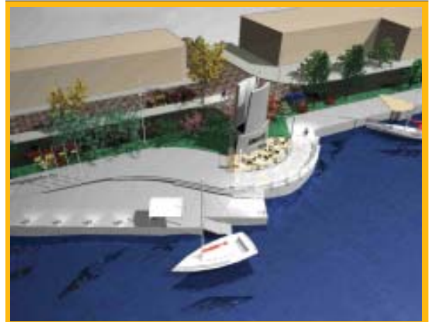
Proyecto: Mirador el Faro, costanera Arturo Prat frente Terminal de Buses.