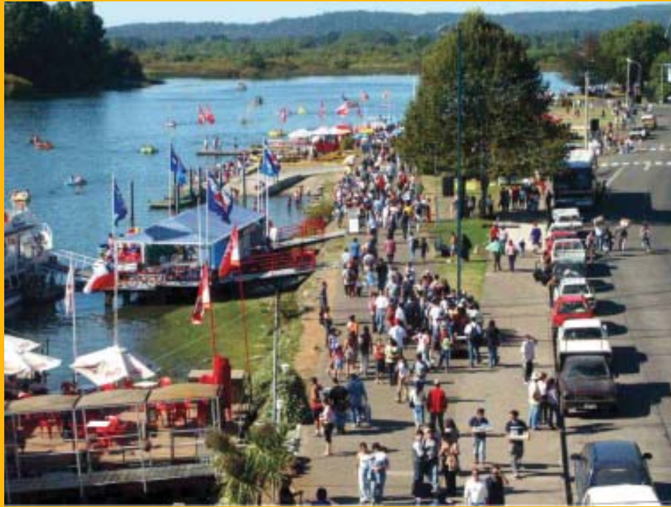
Semana valdiviana: arriba, durante el día; en la noche desfile de barcos (abajo)