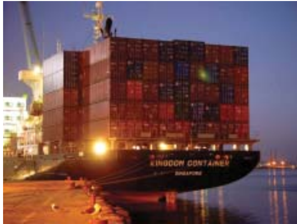
Terminal portuario y movimiento de carga.

En 1999 se definieron las estrategias y cursos de acción para lograr el objetivo general trazado, el cual se enfoca en la presentación y proposición un Plan Director del Puerto de Talcahuano, que permita el desarrollo armónico de la actividad portuaria-comercial, portuaria-pesquera e inmobiliaria, en los terrenos de propiedad de la empresa, considerando un modelo de gestión financiera que haga viable la proposición y se constituya en un aporte urbano para la ciudad.