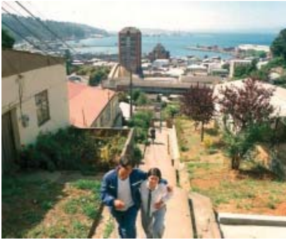
Vista desde los cerros de Talcahuano.

ternacional (SVTI), el último de los cuales lidera -en términos de toneladas transferidos y tecnología asociada a la actividad- el movimiento de carga de todo el gran sistema portuario de la Región del Bío Bío, compuesto por otros seis puertos.