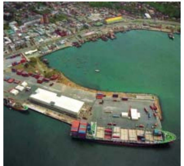
Vista aérea del sector que se intervendrá (vista de E-O).

dano común, sino también para los empresarios e inversionistas que podrían estar interesados en contribuir a la renovación de esta parte de la ciudad, que no es otra zona que la proyección del centro hacia el mar y la bahía de Concepción.