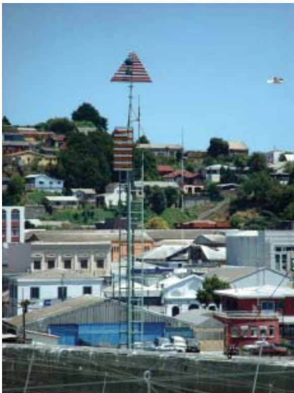
Extensión urbana en cerros de Talcahuano.

Consciente de ello, la Empresa Portuaria Talcahuano San Vicente se embarcó a fines de la década pasada en la ejecución de varias acciones tendientes a materializar, en el mediano plazo, un gran proyecto inmobiliario en las inmediaciones del Malecón Blanco Encalada, en lo que sería la continuación hacia el centro de la ciudad desde el Paseo Blanco, llegando hasta el corazón mismo del área más influyente de la urbe.