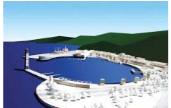
Vista aérea y maqueta del sector que se intervendrá (vista de O a E)

cahuano. Una vez completada esta fase, el proyecto tendrá finalmente luz verde para su ejecución.