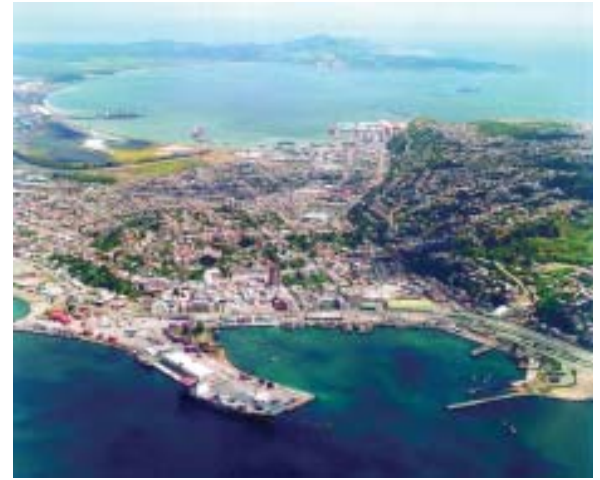
Panorámica de los puertos de Talcahuano y de San Vicente.

La Empresa Portuaria Talcahuano San Vicente, una de las diez entidades estatales autónomas creadas luego de la desaparición de la estatal ex Emporchi (Empresa Portuaria de Chile), a fines de los 90, es propietaria de ambos puertos mencionados y, mientras opera directamente el de Talcahuano, desde el 1