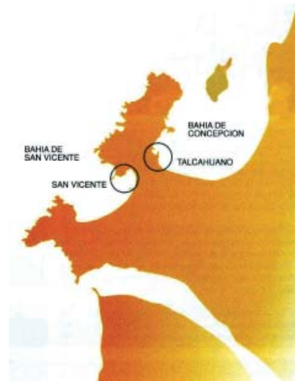
Plano del sector costero de la intercomuna

Los almacenes, bodegas, las oficinas de agencias marítimas y representantes comerciales comenzaron de a poco a definir la nueva fisonomía del centro de la ciudad, especialmente del borde mar adjunto al casquete urbano. De manera paulatina, las mismas construcciones que se emplazaron producto de