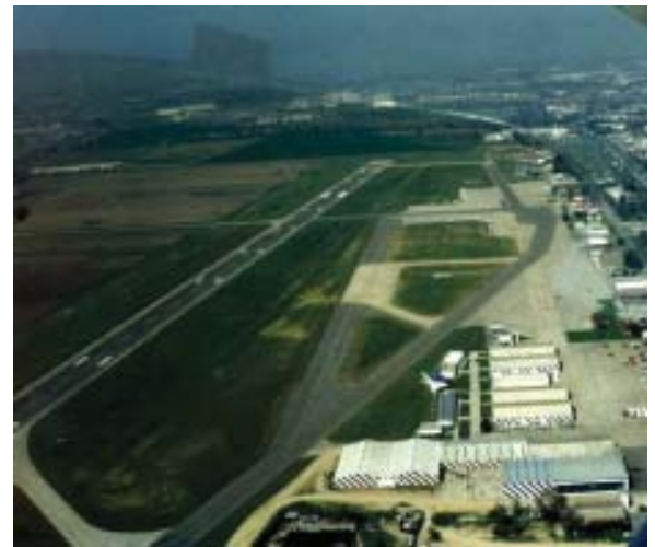
Comuna de Cerrillos: Aeródromo (Pastos y Malezas)

d) Proyectos de colaboración público-privado. Por ejemplo Acuerdos de Producción Limpia-áridos, entre otros.