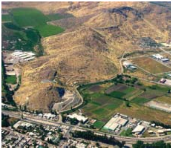
Comuna de Renca: Parque (<10% Arbolado) Quilicura: Cerro (Pastos y Malezas)