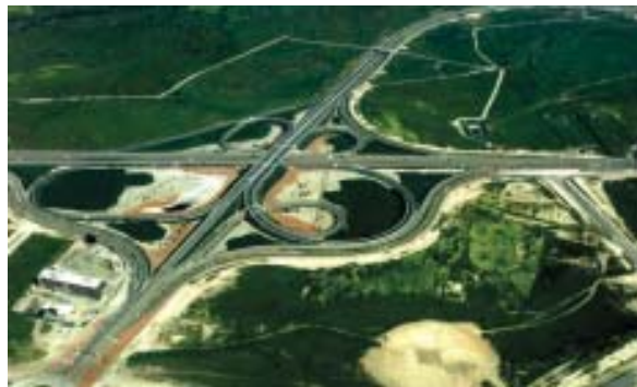
Comuna de Pudahuel: Bandedón (pastos y malezas)

Las instituciones públicas, de esta forma, tendrán la seguridad que la construcción de estas áreas verdes se ejecutará en forma y condiciones establecidas en la Resolución de Calificación Ambiental, así como permitirá solucionar progresivamente el déficit de áreas verdes existente en la Región, esto permitirá adicionalmente utilizar de forma más eficiente los recursos públicos, de manera de destinarlos a aquellas áreas no cubiertas o complementarias con esta Corporación.