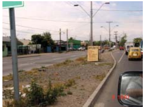
Comuna de La Cisterna: Bandedón sin implementación (Eriazo)