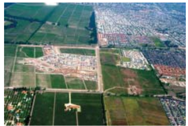
Comuna de Macul: Área verde desafectada (cultivo agrícola y <10% arbolado)