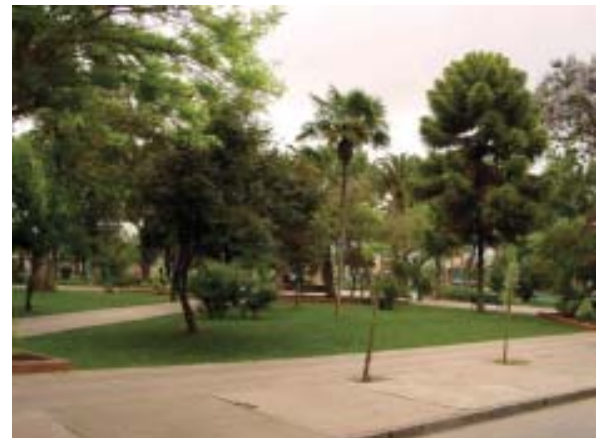
Comuna de Quilicura: Área verde con alta cobertura (>60% arbolado)

Como objetivo general se encuentra mejorar Calidad Ambiental de la Ciudad de Santiago, aumentando la dotación de espacios verdes, a través de co-ordinar un plan estratégico de áreas verdes