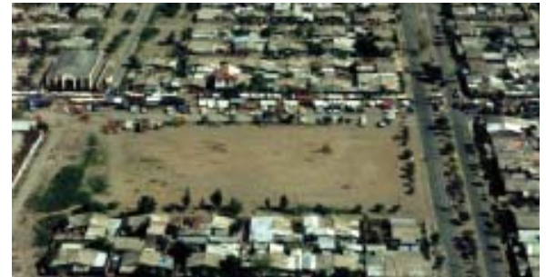
Comuna de Pudahuel: Sitio eriazo

En una primera etapa, se utilizará la Corporación de Amigos del Parque Metropolitano, en la que participará representante del Intendente, del MINVU y de la Cámara Chilena de la Construcción. Esta entidad se estima que cumplirá de forma adecuada, ya que se ha dedicado a buscar recursos y construir