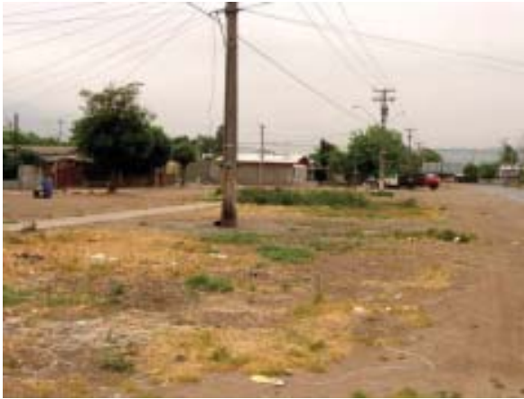
Comuna de Conchalí: Área Verde No Implementada

a posiblemente través de la Ley de Emisiones Transables actualmente en discusión parlamentaria.