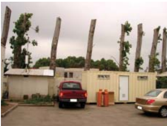
Comuna de Quilicura: Área Verde Desafectada

El Plan Verde es un instrumento de gestión y fomento destinado a incrementar la construcción y mantención de las áreas verdes a nivel nacional y regional, sobre la base del apoyo y la acción coordinada del sector público y privado, mediante la utili-