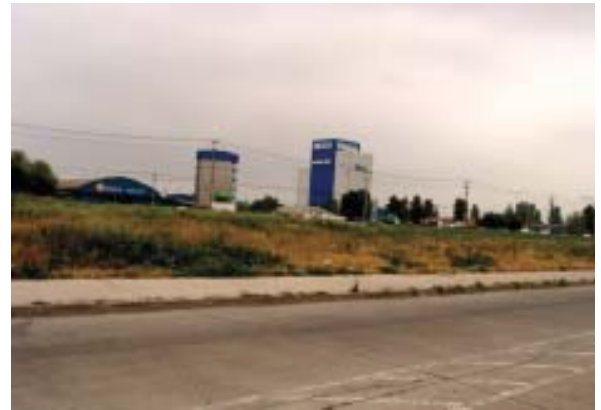
Comuna de Conchalí: Bandejón (Pastos y Malezas)

Actualmente la construcción y mantención de las áreas verdes se encuentra radicada en los Municipios, el Ministerio de Vivienda y Urbanismo y los Gobiernos Regionales. Este último principalmente a través de los recursos que aporta por el Fondo Nacional de Desarrollo Regional (FNDR).