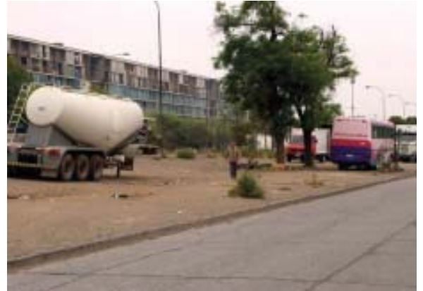
Comuna de Santiago: Bandedón sin implementación (<10% arbolado)

plementación y mantención de áreas verdes; cumplir con la meta territorial de lograr el equilibrio urbano de áreas verdes en la ciudad de Santiago (6 m 2 por habitante en un radio de 20 minutos de accesibilidad, o al menos informar de instancias paralelas que pueda existir en la materia); Con el objeto de asegurar una adecuada participación Corporación