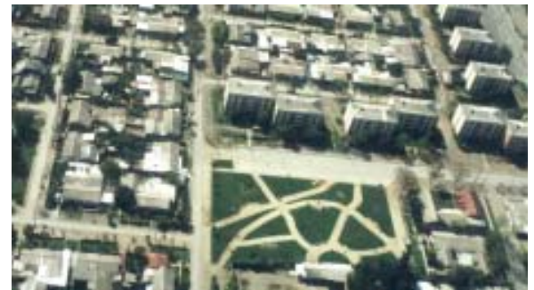
Comuna de Pudahuel: Plaza "implementada" (pastos y malezas)