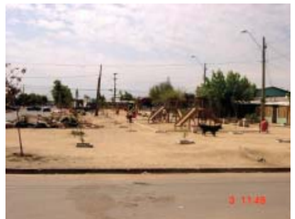
Comuna de El Bosque (*): Plaza Nueva (eriazó)