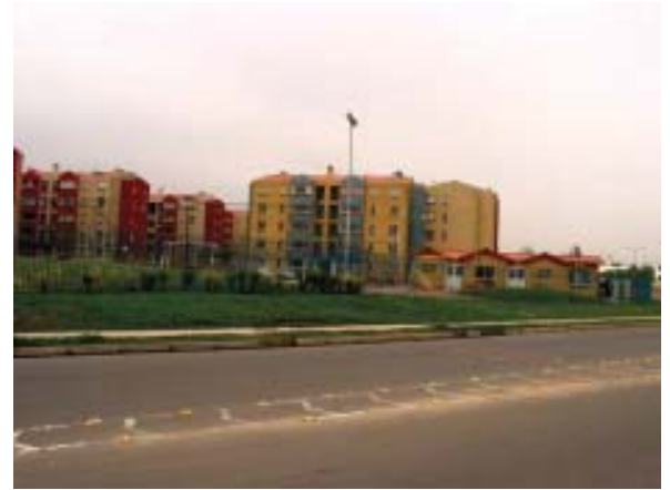
Comuna de Conchalí: Área Verde Desafectada

zación de una institucionalidad que permita unificar los esfuerzos y recursos destinados a incrementar los espacios urbanos con áreas verdes, cumpliendo con los objetivos de carácter ambiental trazados por la autoridad.