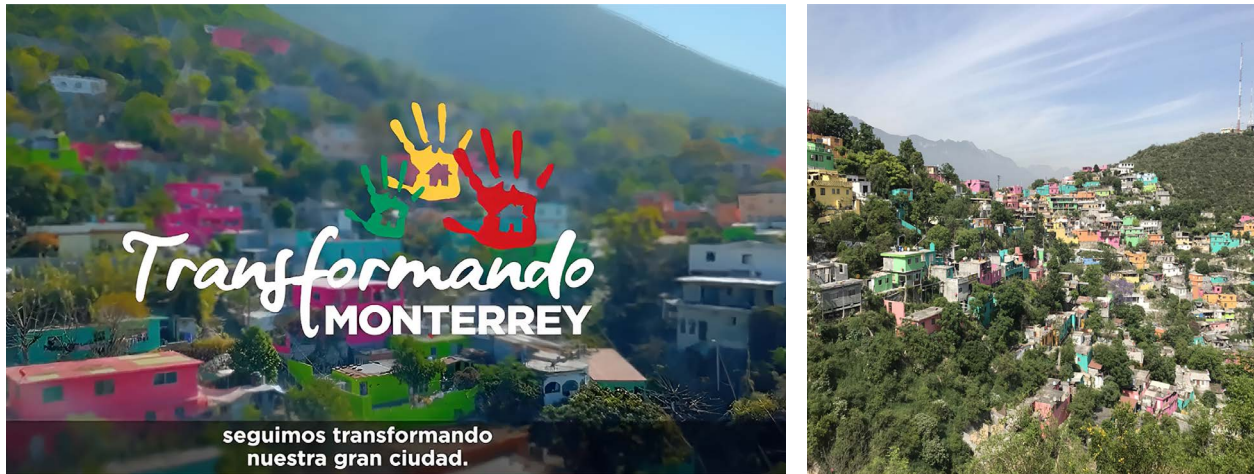
Figura 4. Programa “Transformando Monterrey”.