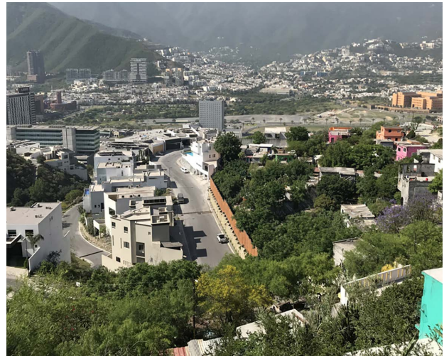
Figura 3. Fronteras físicas. Izq. Escalinatas que llevan a lo alto del cerro. Der. Muro divisorio entre col. Independencia y Fracc. Vista Real.

“Vista Real”, perteneciente al municipio de San Pedro Garza García de la colonia Independencia. Este fraccionamiento cuenta con todas las medidas de seguridad: caseta de vigilancia, cerca electrificada y cámaras. Otro ejemplo son las escalinatas que funcionan como conectores a otras partes de la colonia, las que, por su topografía, no permite el acceso vehicular. Estas escalinatas tienen una función simbólica que marca una diferencia entre los de arriba y los de abajo, los que habitan en asentamientos irregulares o regulares (Figura 3).