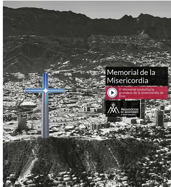
Figura 6. Memorial de la misericordia.

“... la gente grande se va a resistir, nadie ni los de abajo, dile a tu abuelo que venda su casa, tienen un cariño