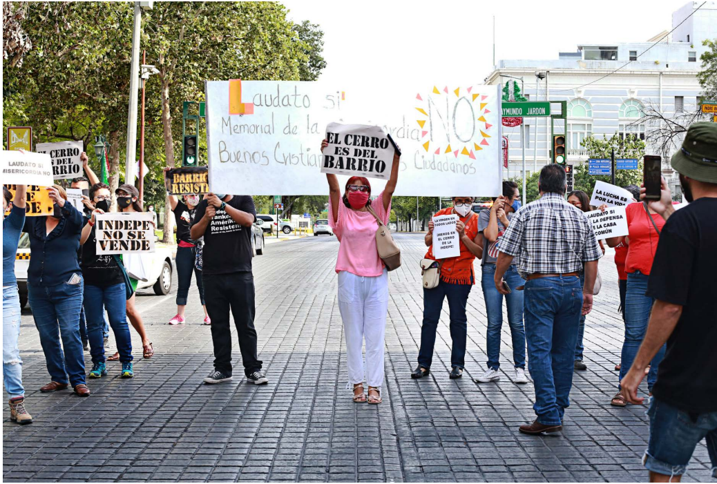
Figura 7. Protesta de vecinos de la Independencia contra el proyecto “Memorial de la Misericordia” realizada el 8 de agosto del 2021.

Therborn (2020) reconoce que las ciudades se convierten en lugares ideales para la concentración de riqueza, pero también lugares de resistencia y contrapoder político. De este modo, los proyectos urbanos aquí presentados han traído consigo diversas opiniones, acciones legales y movilizaciones sociales por parte de los habitantes, quienes buscan hacer frente a estos procesos de revalorización de zonas metropolitanas que siguen lógicas capitalistas (Figura 7).