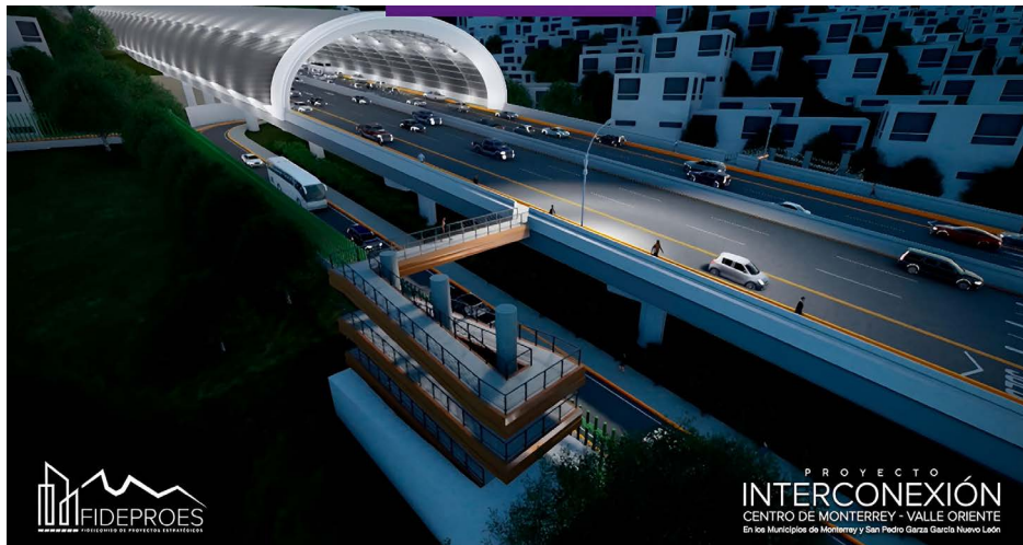
Figura 5. Proyecto Interconexión vial Monterrey-Valle Oriente.

en resolver problemáticas como la falta de servicios básicos, inseguridad en la tenencia del suelo o garantizar el acceso a la salud, trabajo y educación. Además, no existe evidencia de que este programa haya reducido actividades delictivas, ni mejorado la calidad de vida de los habitantes (Figura 4).