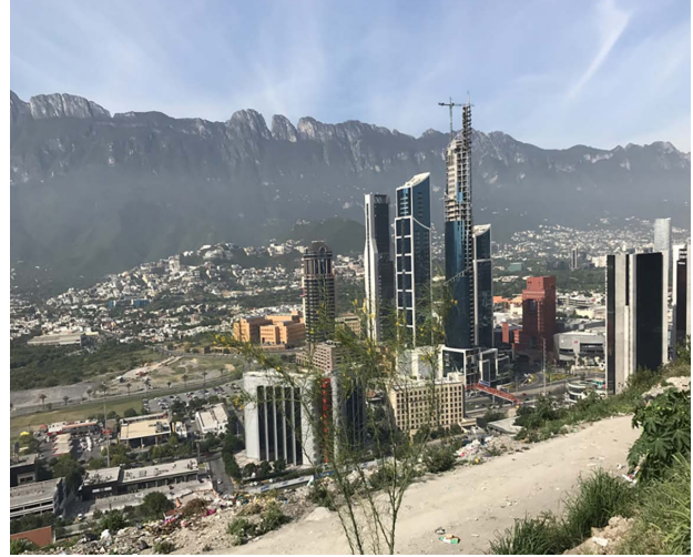
Figura 2. Fronteras naturales. Izq. Vista hacia el río Santa Catarina. Der. Vista Desde el cerro de la Loma Larga hacia San Pedro Garza García.