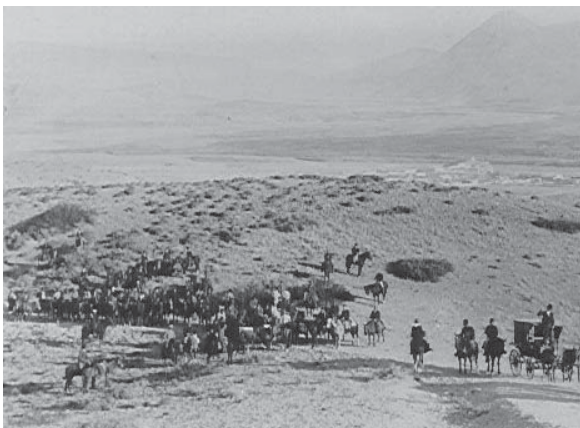
Imagen de la ocupación del territorio de Neuquén.