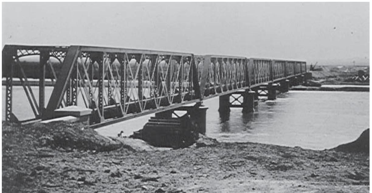
Puente de ferrocarril construido en Neuquén, a inicios del siglo XX.