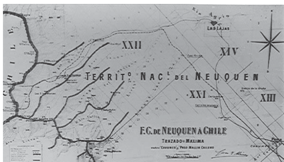
Plano antiguo del territorio de Neuquén.

Es sin duda lo que dificultó tremendamente la vida de relación, el costoso transporte de las mercaderías y de las personas, produciendo un aislamiento y retraso en el desarrollo de la región.