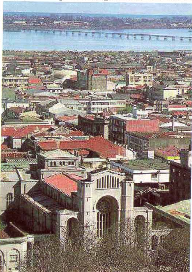
Vista de Concepción. Desde la plaza al río se estructura un eje cívico en los futuros proyectos.

Otra iniciativa relevante es el Plan Bicentenario, surgido tras la voluntad del Presidente de la República, quien nos ha encomendado la tarea de generar una discusión que se traduzca en la materialización de grandes intervenciones urbanas con miras a la próxima conmemoración del Bicentenario de nuestra Independencia. Para ello, las comunas de Concepción, Talcahuano, San Pedro, Chillán, Chillán Viejo y Los Angeles, están generando cada una un