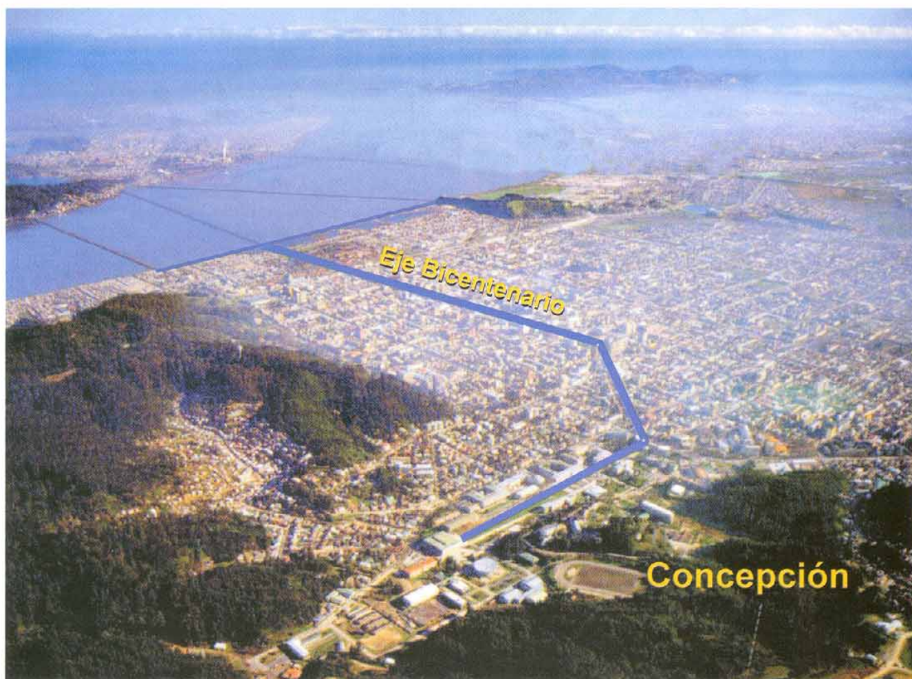
Vista aérea de Concepción que muestra el eje de ordenamiento urbano de la ciudad hacia el Bicentenario.

una imagen-objetivo que permita visualizar y plasmar las potencialidades del desarrollo cívico del interés público y de negocios atractivos para los privados.