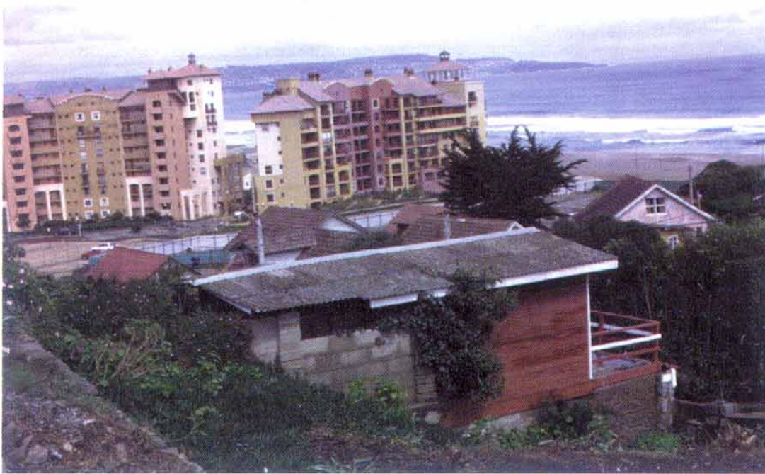
La política nacional de uso del borde costero debe resguardar tipos conceptuales de una zonificación que considera, entre otros, el uso habitacional diverso.

ordenamiento que concilie la ejecución de proyectos privados y públicos con los intereses del país.