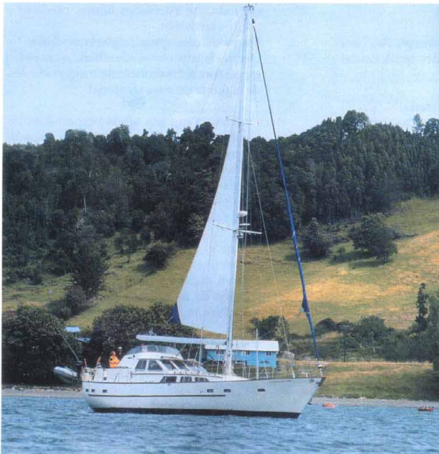
Borde costero turístico, área de uso público para esparcimiento y recreación.