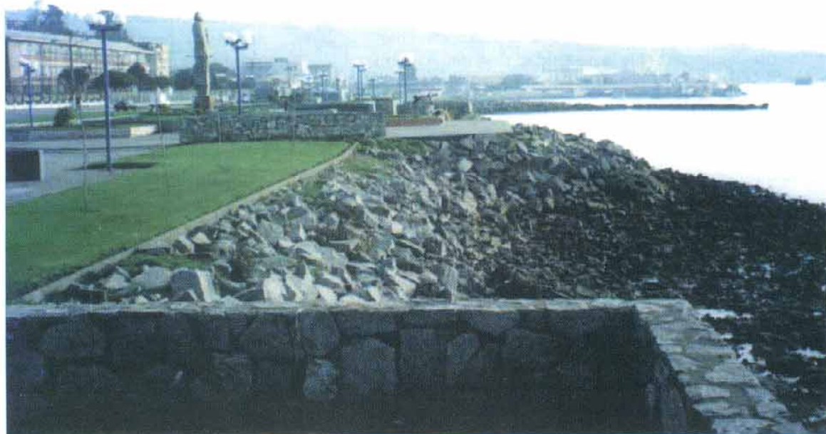
Area de Talcahuano. El borde costero como expresión de una realidad urbana.