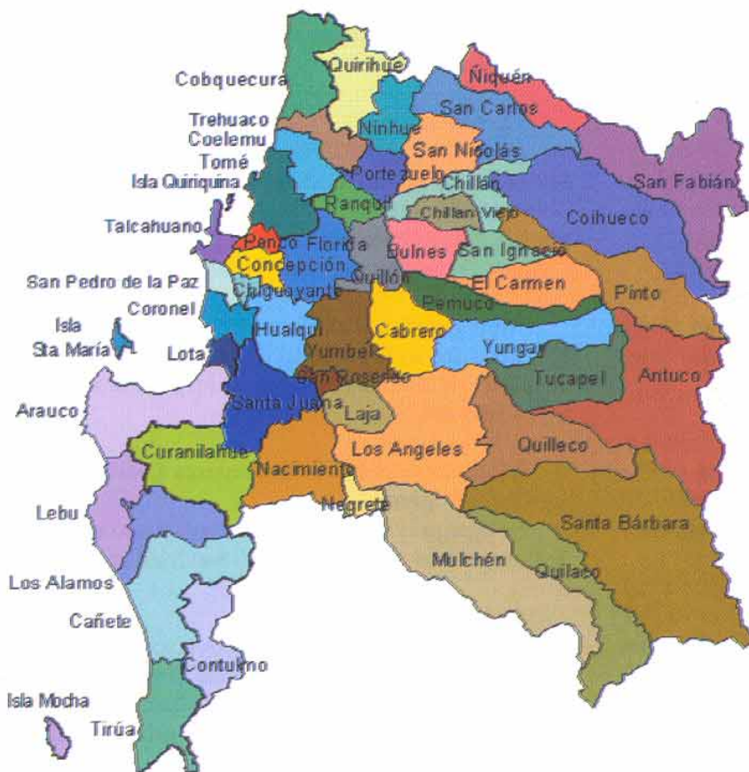
Comunas de la Región del Bío Bío.

Asimismo, en el Artículo 20 de la Ley 19.175, se indica en la letra o) que el Gobierno Regional para el cumplimiento de sus funciones, podrá "promulgar los planes reguladores comunales e intercomunales, de acuerdo a las normas sustantivas de la Ley General de Urbanismo y Construcciones, previo acuerdo del Consejo Regional".