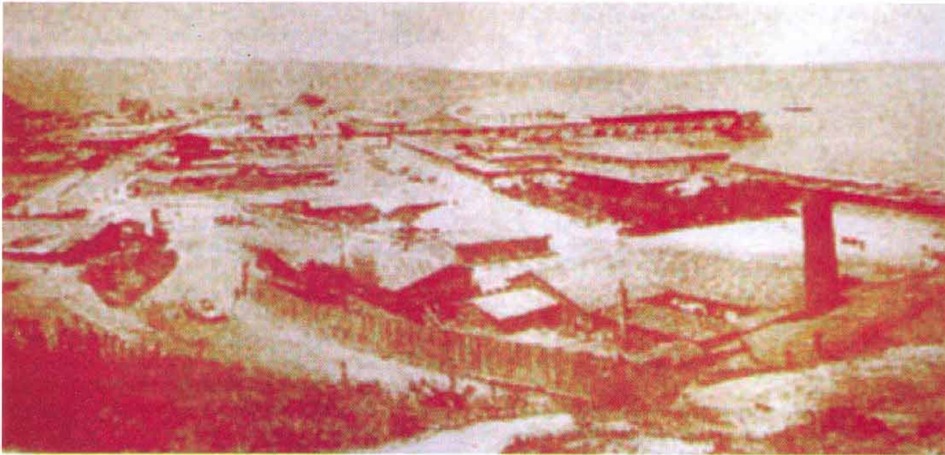
Actividad portuaria bahía de Coronel a principios del siglo XX