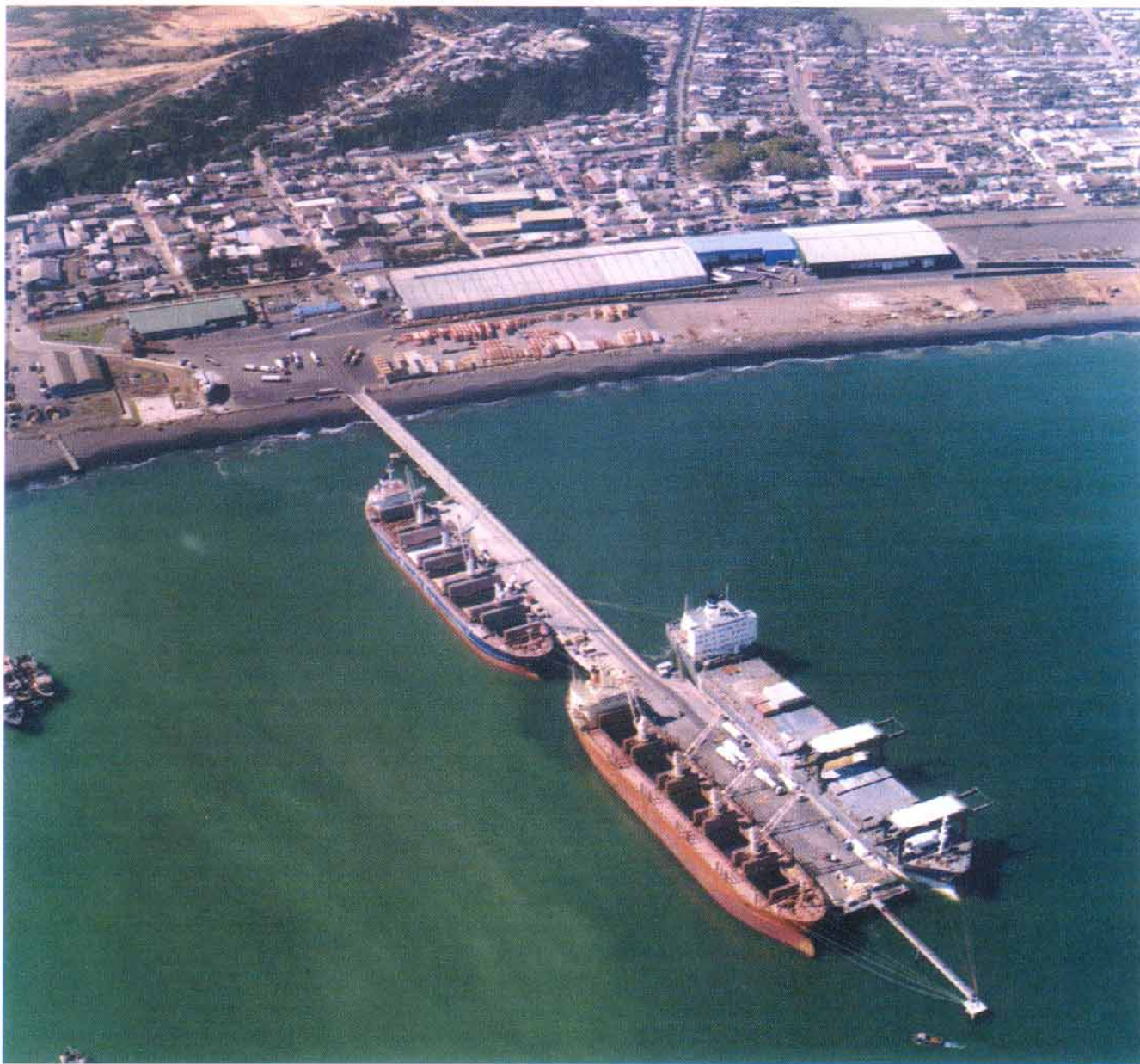
Puerto de Coronel, importante punto de consolidación de la vocación portuario-industrial de la intercomuna.

Entre los proyectos específicos de desarrollo urbano con miras a enfrentar el escenario tendencial del siglo XXI podemos destacar: