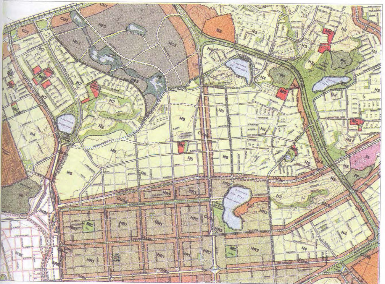
Parte del Plano final del Plan Regulador.

Lo anterior se materializa en un Plan Regulador que propone lagunas incorporadas en un sistema articulado de áreas verdes y de protección, con nuevas vías que se integran al sistema urbano con un rol paisajístico, con arborización obligatoria, amplias veredas y ciclovía, con exigencias de antejardín y de cierros transparentes para los predios que las enfrentan. Es el caso de vías como la "Interlagunas", que vincula las lagunas Redonda y Lo Mendez, de calle Lautaro, que vincula la Interlagunas con la laguna Las Tres Pascualas, de calle Janequeo, que une Las Tres Pascualas con el campus de la Universidad de Concepción, o de calles Lientur y Manuel Rodríguez, que dan acceso a las lagunas Las Tres Pascualas y Lo Custodio respectivamente.