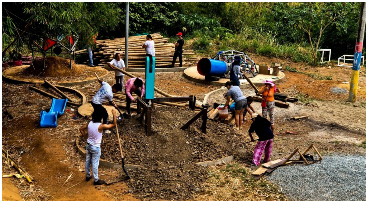
Figura 5: Las mujeres fueron el motor central del ejercicio de trabajo comunitario.