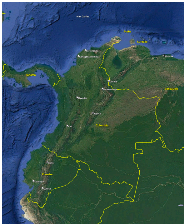
Figura 1: Localización de la ciudad de Cali en Colombia.

y segundo, su rol como potenciador de una red de relaciones vecinales más resilientes y con capacidad de auto-organización.