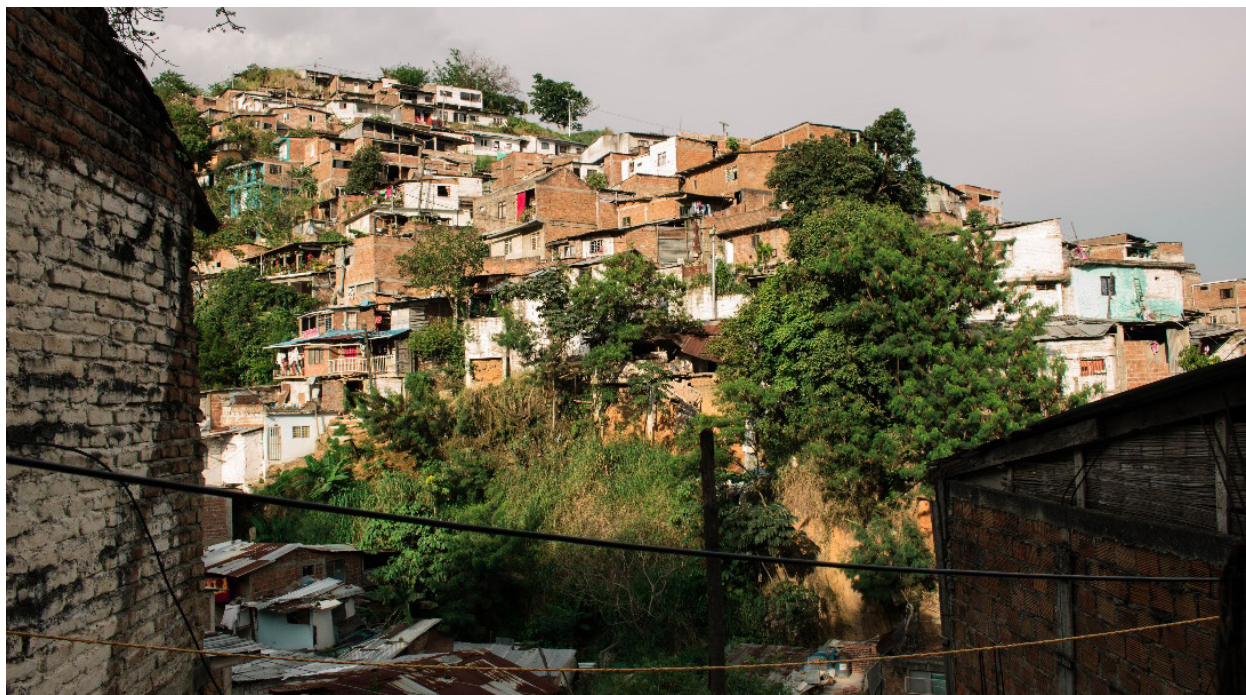
Figura 4: Ocupación del suelo sobre ladera, sector San Francisco. Fuente: Elaborado por los Autores, 2020.