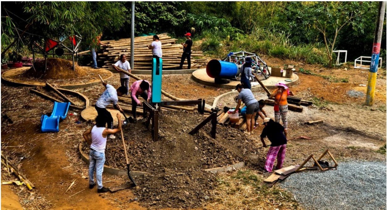
Figura 5: Las mujeres fueron el motor central del ejercicio de trabajo comunitario.