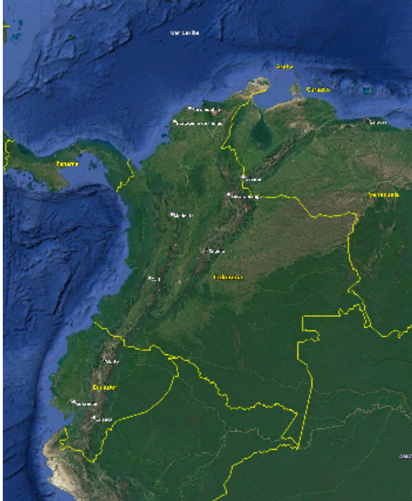
Figura 1: Localización de la ciudad de Cali en Colombia.

y segundo, su rol como potenciador de una red de relaciones vecinales más resilientes y con capacidad de auto-organización.