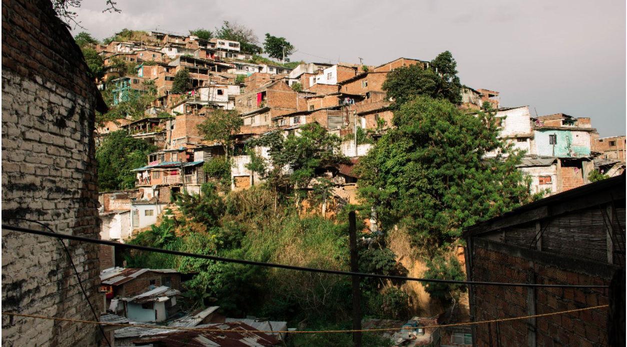
Figura 4: Ocupación del suelo sobre ladera, sector San Francisco.