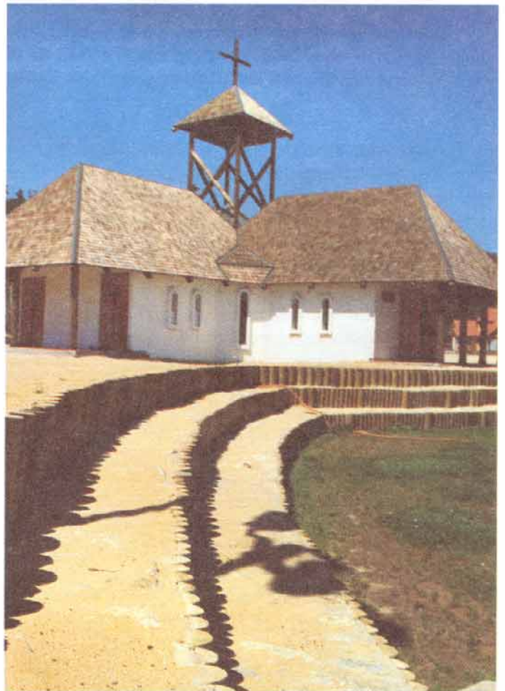
Vista de la Parroquia en Plaza del Sol