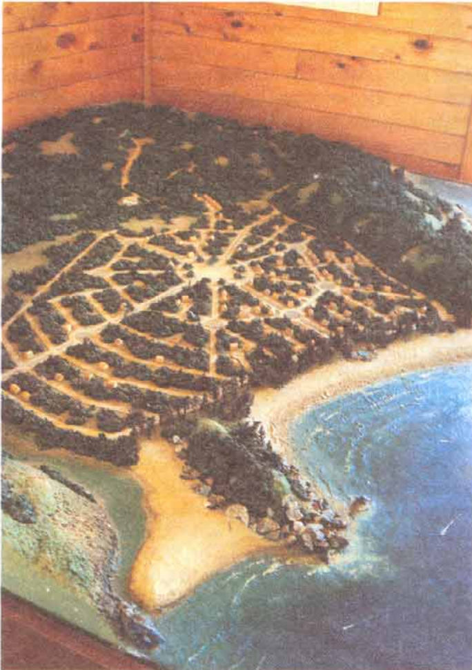
Maqueta del Conjunto

cancha ecuestre y caballerizas, dos áreas de camping, un snack playero, dos áreas de juegos infantiles, miradores y senderos peatonales, una laguna de río equipada, y áreas verdes en plazoletas. Hasta el momento existen 215 casas construidas con una altura máxima de dos pisos y un proyecto de edificación en altura correspondiente a 5 unidades de departamentos de 90, 110 y 150 m 2 .