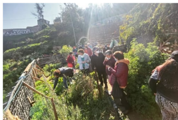
Figura 2: CU de Barón.

departamentos de un 129%, la mayor variación en Valparaíso, muy por sobre el total comunal, con un 49%. Mientras la densidad de la comuna (Hab./ha) aumentó en un 8% entre 2002 y 2017, la densidad del Cerro Barón lo ha hecho en una tasa negativa (-12%) en el mismo período, lo que sugiere la presencia de un mercado de segunda vivienda.