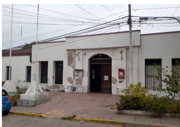
Espacio Comunitario ex Comisaría Barón