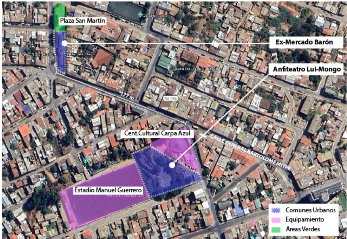
Figura 4. Ex-Mercado Barón y Anfiteatro Lui-Mongo y su entorno.