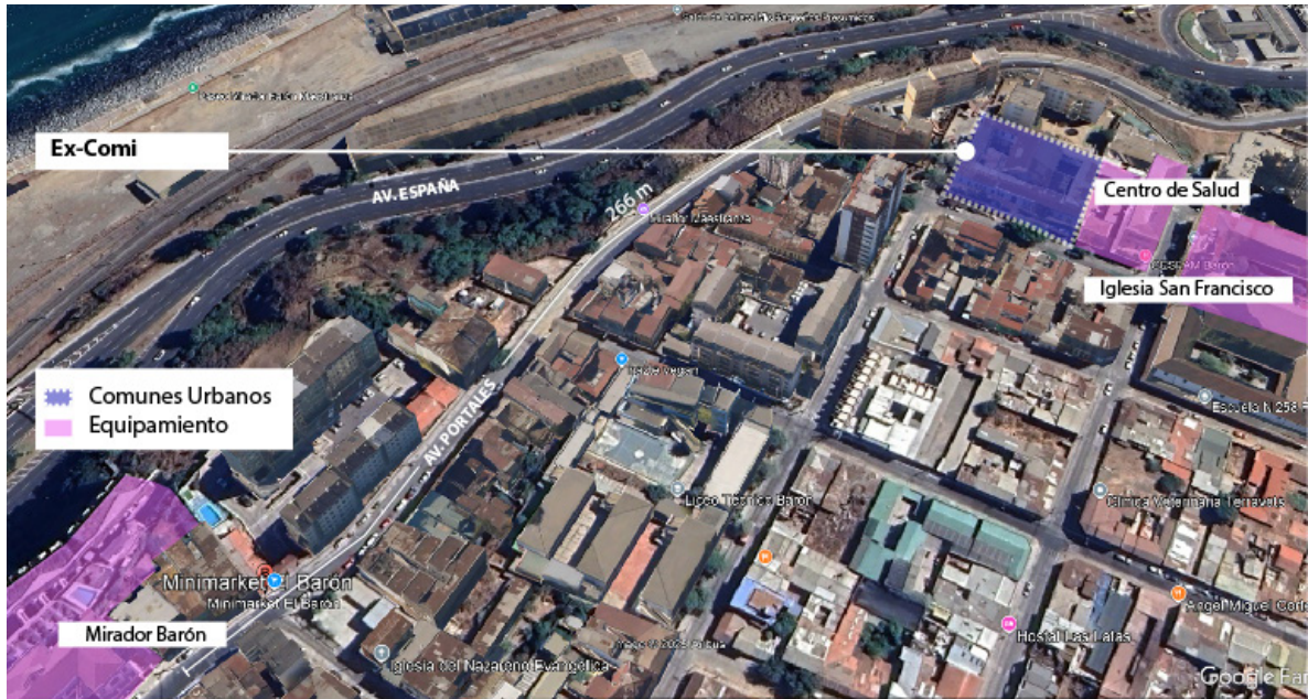
Figura 3. Ex-Comi y su entorno inmediato.