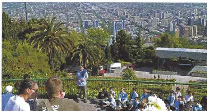
El Parque Metropolitano de Santiago, en el cerro San Cristóbal ( 722 há), obra de la Cormu, constituye una de las áreas verdes urbanas más importantes de Latinoamérica

Valparaíso, de gran importancia histórica en la generación del núcleo primario, desde el cual se desarrolló esa ciudad.