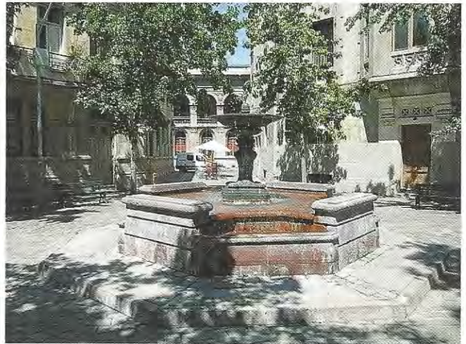
Fuente urbana en las estrechas calles del “barrio” Brasil en sector pericentral de Santiago, cuya presencia organiza la vida e identidad entre residentes, inmobiliarios y equipamientos

Es curioso el hecho de que la tipología edificatoria de combinación de torres de 20 pisos, que se habían experimentado en San Borja y bloques de 4/5 pisos, que se habían aplicado en algunas remodelaciones del sector poniente al centro, hayan sido reemplazadas en la actualidad por la tipología edificatoria que se aplicó en las últimas décadas en el sector oriente de Santiago. Es posible que este modelo de densificación se haya intentado en experiencias posteriores de la Cormu, como el proyecto de seccional Mapocho-Bulnes, por ejemplo. Contrasta la aparente lógica del modelo proyectado por la propia CORMU en su época, con la lógica virtual del modelo de desarrollo inmobiliario que la empresa privada