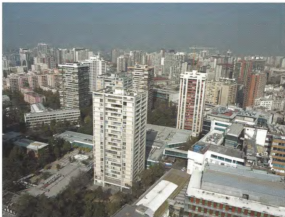
Vista de la Remodelación San Borja, símbolo de la institucionalidad urbanística chilena en el periodo de los años 60 y 70 del siglo XX.

KEYWORDS: urban improvement, renovation, urban planning