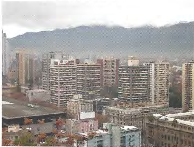
Conjunto habitacional de Remodelación de las Torres de San Borja, en el límite de los terrenos del Hospital San Borja y que impulsa por densidad, el diseño de un Plan Seccional de tránsito urbano

“Este nivel determinaba una unidad básica de vivienda de 70 m 2 útiles y las condiciones urbanas aconsejaban para este sector una densidad media neta del orden de los 1.000 hab/ Há. que agrupados en edificios torres de 20 a 22 pisos permitían la liberación de una proporción mayor del área disponible, para ser destinado con fines de equipamiento tanto metropolitano como vecinal”. 14