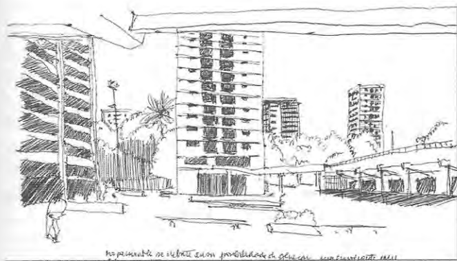
Programa San Borja, uno de los primeros lineamientos de “áreas de remodelación”, definido en el Plan Intercomunal de Santiago.

El potencial de densificación que se percibe en los sectores centrales más antiguos de Santiago, se apoya en la observación de los procesos de transformación y cambio que presentan los sectores vecinos al centro metropolitano en pleno desarrollo hacia los sesenta, que calzaba territorialmente con el núcleo original de la ciudad de Santiago. Mientras este núcleo se consolida con funciones urbanas no residenciales, los sectores vecinos comienzan a recibir la población residente en el centro constituyendo un anillo de barrios residenciales que llegan a presentar notables diferenciaciones físicas y culturales a comienzos del siglo XX.