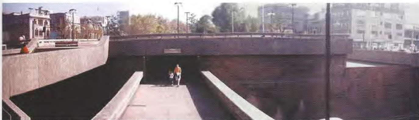
Plaza en superficie en actual Estación Los Héroes del Metro de Santiago, inmediata a la Avd. Norte Sur y al sector mixto considerado en Concurso Internacional para remodelación del área central

2 del ferrocarril Metropolitano. Como esta obra era a tajo abierto y bajo nivel, se producía un corte en la continuidad urbana. Se requería por tanto una solución que integrara espacialmente los sectores, a ambos lados de esta vía.