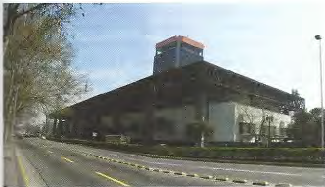
Emblemático edificio UNCTAD, ex Centro Diego Portales y actual Edificio GAM, inserto en el área urbana inmediata a la remodelación de San Borja

Compañía y Agustinas. Esta tendencia se manifiesta en la actualidad y es un factor distorsionador del concepto de barrio planteado en la misma propuesta seleccionada.