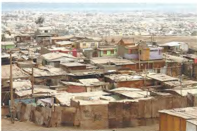
Campamentos resultantes de “tomas” masivas de terrenos, cuya acción se consideraba fuera del objetivo de creación de la Cormu, centrado en el mejoramiento urbano

La labor desarrollada por Cormu desde su creación, que estuvo muy ligada a la experiencia del proyecto San Borja, había sido fundamentalmente de Remodelación Urbana dirigida a satisfacer la demanda de estratos socio-económicos de nivel medio y alto, así como a la creación de sociedades mixtas destinadas a realizar proyectos de equipamiento. Posteriormente, la acción de Cormu a través de sus líneas de Remodelación, Rehabilitación, Densificación y otras, se orienta a satisfacer la demanda de los sectores socio-económicos más postergados. La Cormu debe enfrentar con un programa de emergencia, durante el año 1971 el problema habitacional de esos sectores, cuya urgencia se manifestaba a través de las “tomas” masivas de terrenos, que originó los denominados “Campamentos”. Esta acción se consideraba, sin embargo, fuera del objetivo para el cual había sido creada: el “mejoramiento urbano”.