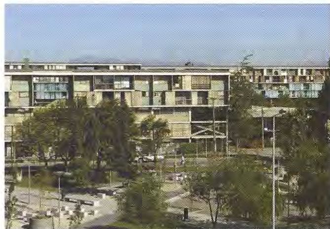
Unidad Vecinal Portales, importante obra intersticial que fuera una excepción a la política de expansión urbana periférica desarrollada por esa Corporación

de proyectos de desarrollo y mejoramiento urbano y otras facultades” 8 , habrían de permitir la ejecución de nuevas obras de desarrollo urbano que la Corvi no había podido realizar. Los grandes proyectos de la ella, en general habían sido de expansión periférica, a excepción de algunos proyectos de carácter intersticial como la Unidad Vecinal Portales, o algunas etapas complementarias en la Población Juan Antonio Ríos.