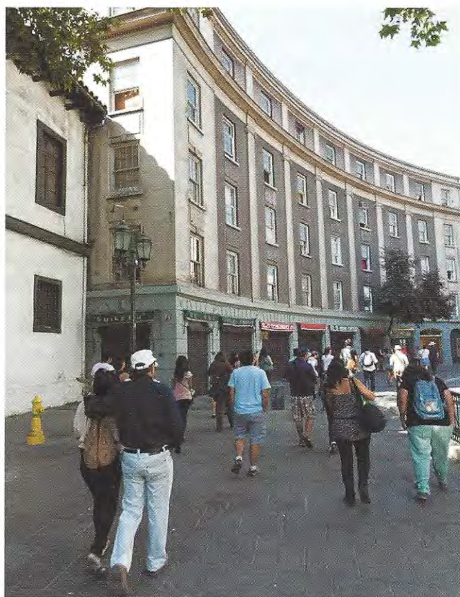
Ingreso al sector del Seccional San Francisco (calles Paris-Londres) en el centro de Santiago, como ejemplo de un espacio urbano recuperado para el peatón.

En esta época también, se inician trabajos de recuperación en otros espacios abiertos del área metropolitana como el balneario Chacarilla en el Cerro San Cristóbal (Parque Metropolitano) y restauración de la Iglesia La Matriz en