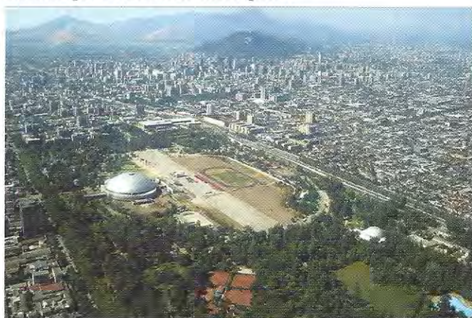
Ex parque Cousiño, actual Parque O'Higgins, por su dimensión, centralidad y carácter, constituye un área verde metropolitana de gran singularidad y privilegio

“Del estudio de las áreas existentes en la ciudad de Santiago, se desprende un acentuada déficit de las mismas, el cual gravita, tanto en un peligroso desequilibrio ecológico, como en la falencia casi absoluta de las zonas de recreación al aire libre destinadas a las sectores más populares de la población; al mismo tiempo se observa una acentuada desproporción de mancha verde en el sector Oriente de la ciudad en desmedro de los sectores céntricos y periféricos de la misma, lo cual constituye una expresión más del carácter clasista que evidencia la metrópoli.” 26