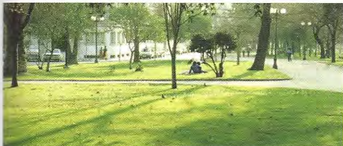
Parque Forestal, área tradicional de esparcimiento de la ciudad que responde a una política de recuperación del paisaje propiciada por la Cormu

“Si agregamos a este fenómeno el lamentable y paulatino deterioro, parcelación y menoscabo que han sufrido las áreas tradicionales de esparcimiento tales como el Parque Forestal, Parque Cousiño, Quinta Normal y plazas comunales, se hace evidente la impostergable necesidad de reemplazar la escalada de deshumanización clasista que ha evidenciado el caótico crecimiento de la ciudad, por una política de recuperación de nuestro paisaje, nuestras tradiciones populares y hábitos de recreación, orientándonos ahora hacia las sectores más pauperizadas de la Población”. 27