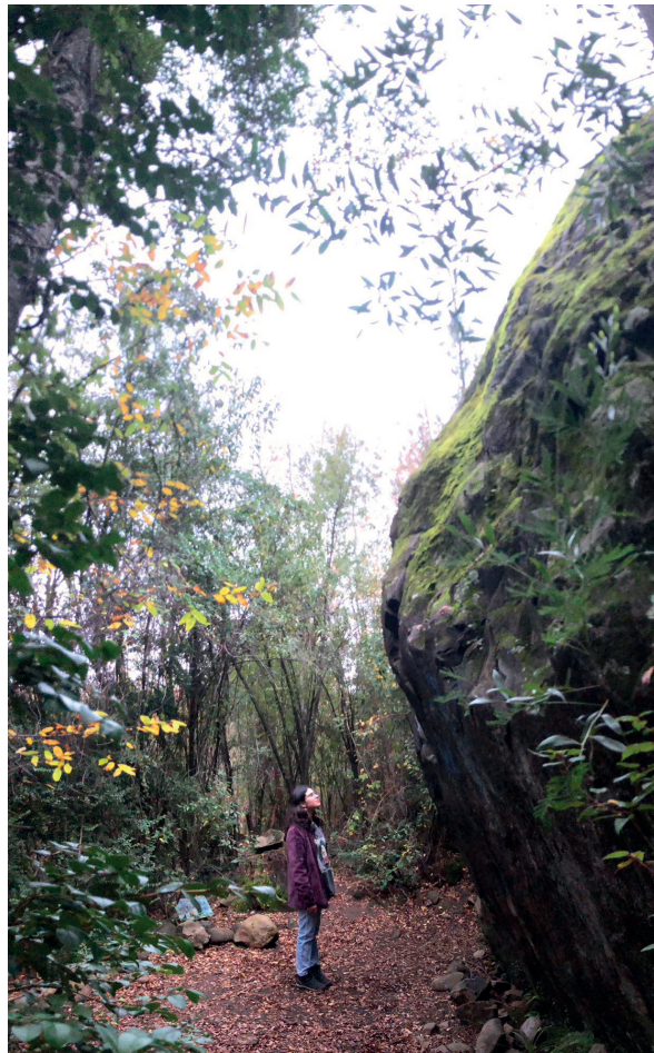
Figura 1: Monumento Arqueológico Nacional Histórico Piedra Retxikura.

En torno a la Piedra Retxikura, el proyecto de urbanización "Lomas del Lago Villarrica" crea un conjunto de 600 unidades residenciales, 640 estacionamientos vehiculares y 7 locales comerciales. El proyecto de 6,75 ha busca extender a la ciudad en dirección hacia el lago, irrumpiendo con fuerza en el sector