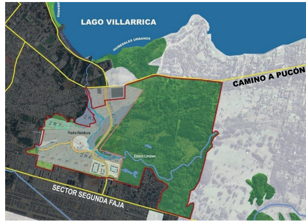
Figura 2: Proyecto Inmobiliario Lomas de Villarrica y Avenida Alto Costanera.

Esa presión inmobiliaria ha empezado a impactar a tierras indígenas periurbanas de ciudades como Temuco (Rojo-Mendoza et al., 2022; Prada-Trigo et al., 2021). Núñez et al. (2022) postulan que estas lógicas urbanas tensionan a los lugares de significancia cultural de los pueblos indígenas y sus formas tradicionales de vivir en comunidad. Al revisar la literatura reciente, destacan casos donde la urbanización afecta a ceremonias espirituales en una comunidad indígena en la comuna de Padre Las Casas (Imilan et al., 2023), donde una subestación eléctrica del Metro afecta al rewé de un terreno municipal vecino 4 en Pudahuel, Región Metropolitana de Santiago (Caulkins et al., 2023) o de desarrollo inmobiliario al