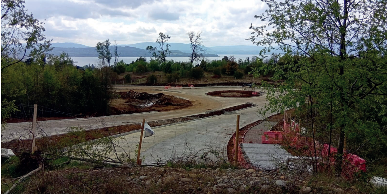
Figura 4: Avenida Alto Costanera. Fuente: Elaboración de los autores (2025).