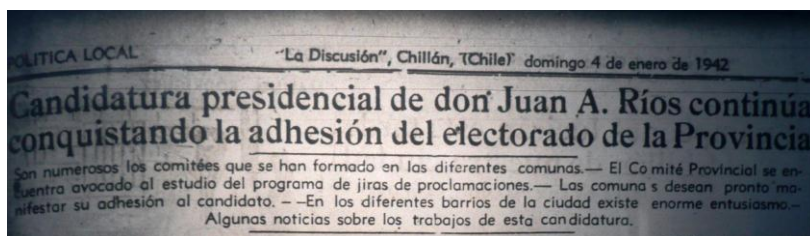
Imagen 5. La Discusión , 4 de enero de 1942.