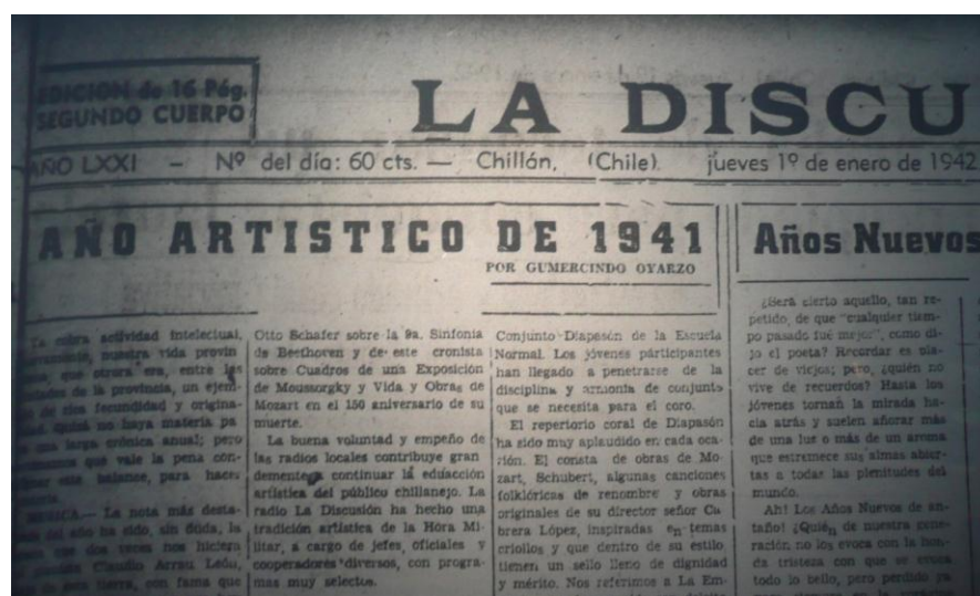
Imagen 1. Año Artístico de 1941, 1º de enero de 1942, Chillán, Chile

La labor de Siqueiros y del conjunto de los muralistas llegó a ser una actividad de vital importancia y orgullo para Chillán, donde no sólo se destaca el valor de fraternidad tras esa obra, debido a que fue un obsequio de México para Chile, sino la alta calidad artística de dicha realización. El arte mural comenzó a captar el interés de la población, presentándose incluso Exposiciones de Proyectos de Pintura Mural en la Escuela España en Chillán. Esto último demuestra, que la llegada de Siqueiros tuvo un alto impacto artístico, haciendo relevante el tema del arte monumental. Así, Gumercindo Oyarzú menciona que, en realidad, la pintura mural está en un despertar enorme, del que se espera un gran renacimiento artístico para el futuro y hemos de felicitarnos que sea nuestra ciudad punto de iniciación de las nuevas formas de este noble procedimiento, tan usado en el cuatrocientos y que se ha abierto paso en la moderna pintura mejicana (Oyarzú, G. 1942).